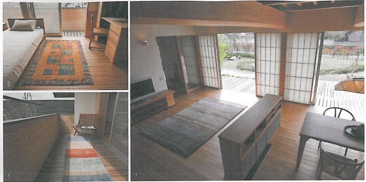
1 / リビングにはソファ代わりにアートギャッベを敷き、床座の暮らしを楽しむ。 2 / 薪ストーブの炎とアートギャッベの相性も抜群。 3 / ベッドサイドに敷けば、一日の始まりと終わりにアートギャッベの足触りを堪能できる。 4 / 畳よりもやわらかいアートギャッベは和室にも調和する。 5 / アート性が高く自然素材でつくられるアートギャッベは、子どもの五感を育むのにも最適。 6 / デッキなど外部に持ち出して使うのも楽しい。