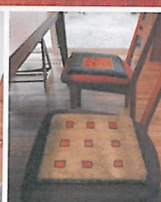
上/子どもたちもギャッベの上で寝転ぶのが大好き。赤は茜の根で染められ、夕日に燃える山々を表現しているかのよう。左下/玄関ではジャストサイズの赤いギャッベが家族や来客を迎える。右下/クッション代わりに用いたミニギャッベ。夏も冬も1年中心地よく使うことができる。

心まで豊かにする 一生ものの絨毯 アートギャッベをはじめ見る人は、その鮮やかな色調やモダンアートをほうふつとさせるデザイン性の高さに驚くだろう。実用品とは思えない色調やデザインの源は、彼らが生活する山岳地帯の風景であると言われている。たとえば、赤は山を染める夕陽、青は空や湖、緑は草原、茶は荒涼とした大地といった具合に、織り手の女性たちが目にしたものが憧れのもとに、その時々イメージが表現されていく。 アートギャッベのある暮らしは、空間はもちろん、私たちの心まで豊かにしてくれるだろう。小さいお子さんのいる家庭にもおすすめだ。自然素材なので安心であるのはもちろん、美しい色調やすぐれたデザインが、子どもの五感を育んでくれるに違いない。 アートギャッベの頑丈なつくりは一生ものと言われている(実際に100年前につくられたオールドギャッベを目にすることもできる)。家族とともに時を過ごし、家族の成長を見守ってくれるだろう。