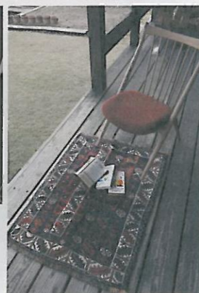
上 古民家調のインテリアと調和するビビッドな多色使いのアートギャッベは、神部邸の生活の一部となっている。左下 家族も愛犬もギャッベの上が大好き。右下 ひとつも大地の上で使われるギャッベは、ウッドデッキとの相性も抜群。