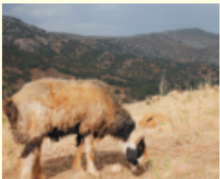
↑昼夜の気温差が大きい山岳地で遊牧されるカシユガイ族の羊。放熱・保温に優れた毛質を持つ。

そして彼女たちが紡ぐ糸も、山岳地帯の遊牧生活があつてのもの。高地で育つ羊は放熱・保温がしやすい毛質で、冬を越した羊毛はとくに上質な糸になる。昔ながらの方法で手紡ぎした糸は脂肪も適度に残るため、水を弾く効果がある。自然の草木で染めた糸の美しい色彩で織られる文様は、古来のシンボルや母から継いだ柄などがあり、それぞれに幸福を願う意味が込められている。荒涼とした地で暮らす遊牧民の女性たちは、色へ