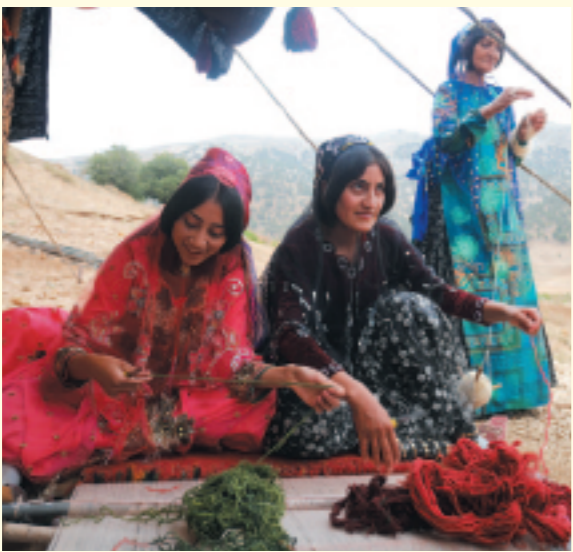
←織り目が細かいほど品質が良いとされるギャツベ。陽気なカシユガイ族の女性たちは楽しみながら作業する。

カシユガイ族の女性に伝わる絨毯「ギャツベ」の手織り技術は、ユネスコ無形文化遺産にも登録されている。嫁入り道具や子どもの誕生など、人生の節目に織る風習が古くからあり、母から娘へ代々受け継がれてきた伝統の技である。なめらかな肌触りでいて、汚れに強い織物となるのは理由がある。