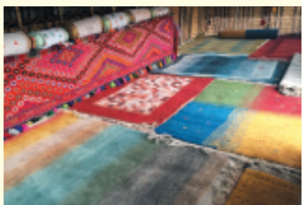
→カシユガイ族の遊牧テントで日常的に使われるギャツベ。この上で生活し、眠りにつく家族を守る大切な道具になる。

の憧れが強く、色彩感覚が研ぎ澄まされている。草原や大地の色あい、夕陽の赤や夜空の濃紺。そこには自然を敬う世界観や、家族の幸せを願うやさしい思いが表現されているのだ。しかし色やデザインに特別な決まりごとはなく、織り手の感性で自由に織り上げるため、個性豊かで絵画のように美しいことが、ギャツベの大きな魅力。素朴なあなたかみとモダンな印象をあわせ持つ芸術性は、世界中に愛好家がいるという。そのなかでも、羊毛の質や織りの技術、デザインがとくに優れているものだけが『アートギャツベ』と呼ばれる。日本でこの呼称があるギャツベは、本物の証といえるのだ。