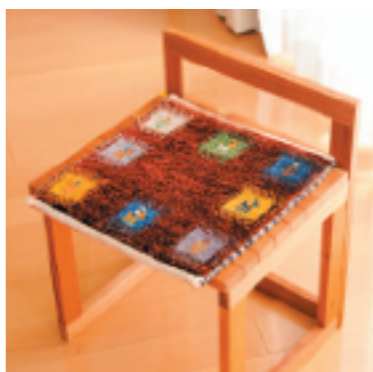
←座布団にもできるミニサイズは1万5000円ほどの価格で販売されている。使い勝手がよく人気が高い。

簡単だから気兼ねなく使えるとも。「水を弾くので何かこぼしてもすぐ拭き取れます。目が詰まっているから掃除も楽で、飼っている猫が爪を掛けても解れないほど丈夫。何十年も長持ちするので、孫の成長に寄り添えるのもいいですね」 自然素材なので、使うほどに味わいが増すのも魅力と佐藤さんはいう。家族の記憶とともに、世代を超えて受け継いでもらえる贈り物ができ、満足しているそう。